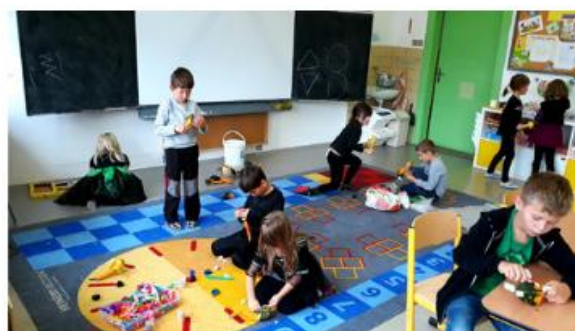
a vymysli, co je jejím úkolem