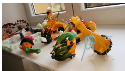
vznikly nádherné bytosti!