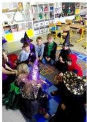
sešli jsme se v kostýmech ...