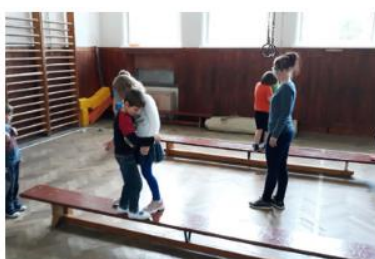
a písmenko M jako "mineme se"