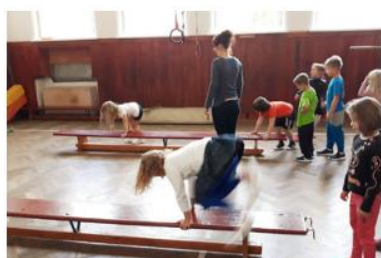
malá medvíďata cvičila ..