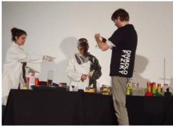
byl i pomocník z davu ...