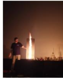
Ještě ohňový vír na konec