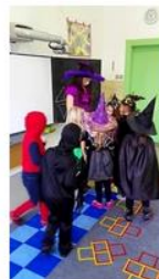
... a jak za mořem v Anglii