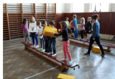
mravenečci zase přenášeli kostky cukru přes lávky ..