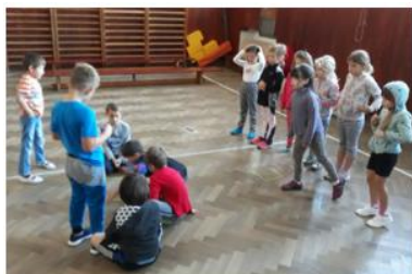
z našich "brčkojehel" jsme skládali