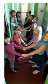
písmeno M ... a jdeme na oběd! Mňam!

Koncem týdne jsme v tělocvičně objevili další písmenko. Počasí je již opravdu podzimní, a tak trochu "mrzneme," než si zvykneme. Na chvíli jsme se vžili do kůže obyvatel Severu, o kterých jsme si přečetli v Živé abecedě. Nazýváme je Eskymáky... Také jsme se ale stali