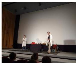
vezme si pláště, rukavice a ochranné brýle ...