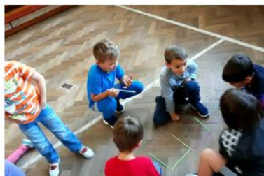
další písmenko E