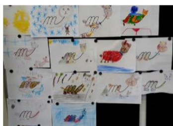
M jako medvěd či medvídek, medvídě ...