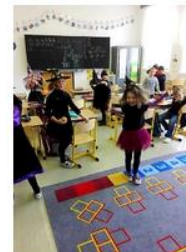
strašidelný rej ..