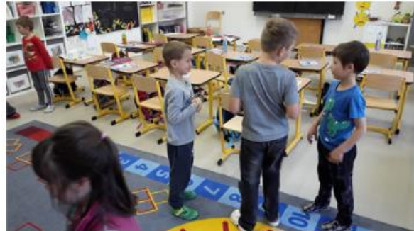
hrajeme s prsty a tleskáním ...