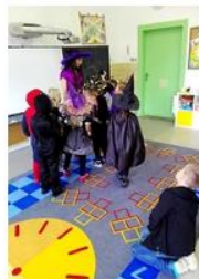
jak jej slavíme v Čechách ...