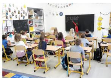
čteme s paličkou ...