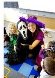
vypadal děsivě, ale nebyl takový přátelský!