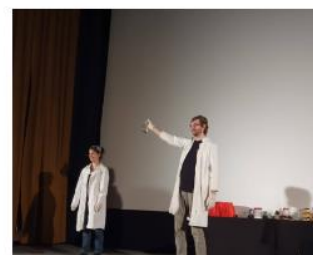
... a baňku!