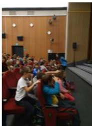
čekáme v kině na začátek ..

https://drive.google.com/file/d/18UsczYB6FJEPH-5742T-nZrYDRn2ftex/view?usp=sharing V úterý jsme se sešli v Divadle úžasné fyziky (Údif), abychom shlédli představení Vojty a Saši na téma oheň. Dozvěděli jsme se spoustu zajímavostí, ale hlavně jsme si, slovy dětí, odnesli potvrzení, že s ohněm si není radno zahrávat! Dozvěděli jsme se, jak hasit i nehasit oheň a shlédli spoustu "kouzel" z oboru fyziky i chemie.