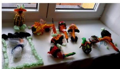
.. a tam v rohu je neviditelný Laskavec