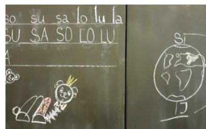
objevili jsme Sever!