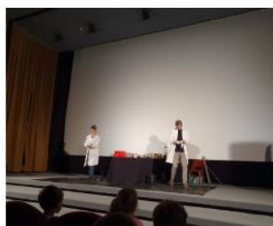
A jak se z fyzika stane chemik?