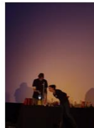
ukázali nám, jakou barvou co hoří