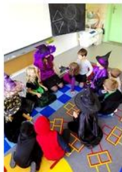
abychom si povídali o svátku mrtvých ...