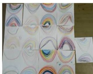
horní a dolní oblouk? ... prostě duhy v kouzelné zemi, kde jedna zrcadlí tu druhou