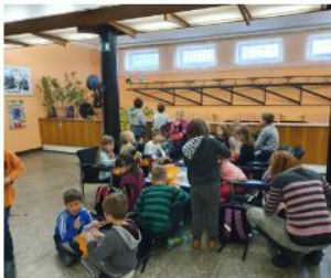
sváča než přijede autobus