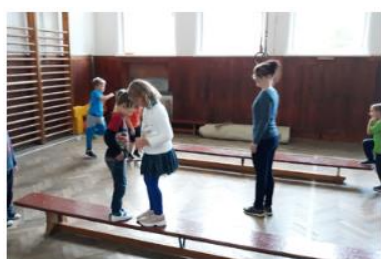
rozloučení s písmenkem L jako lavička ...