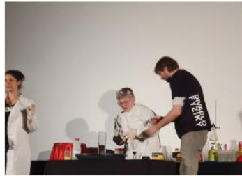
něco s něčím smýchal a ono to vypěnilo!