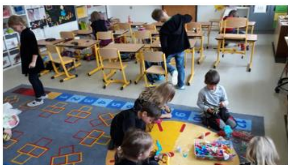
vytvoř skřítko či pohádkovou bytost ...